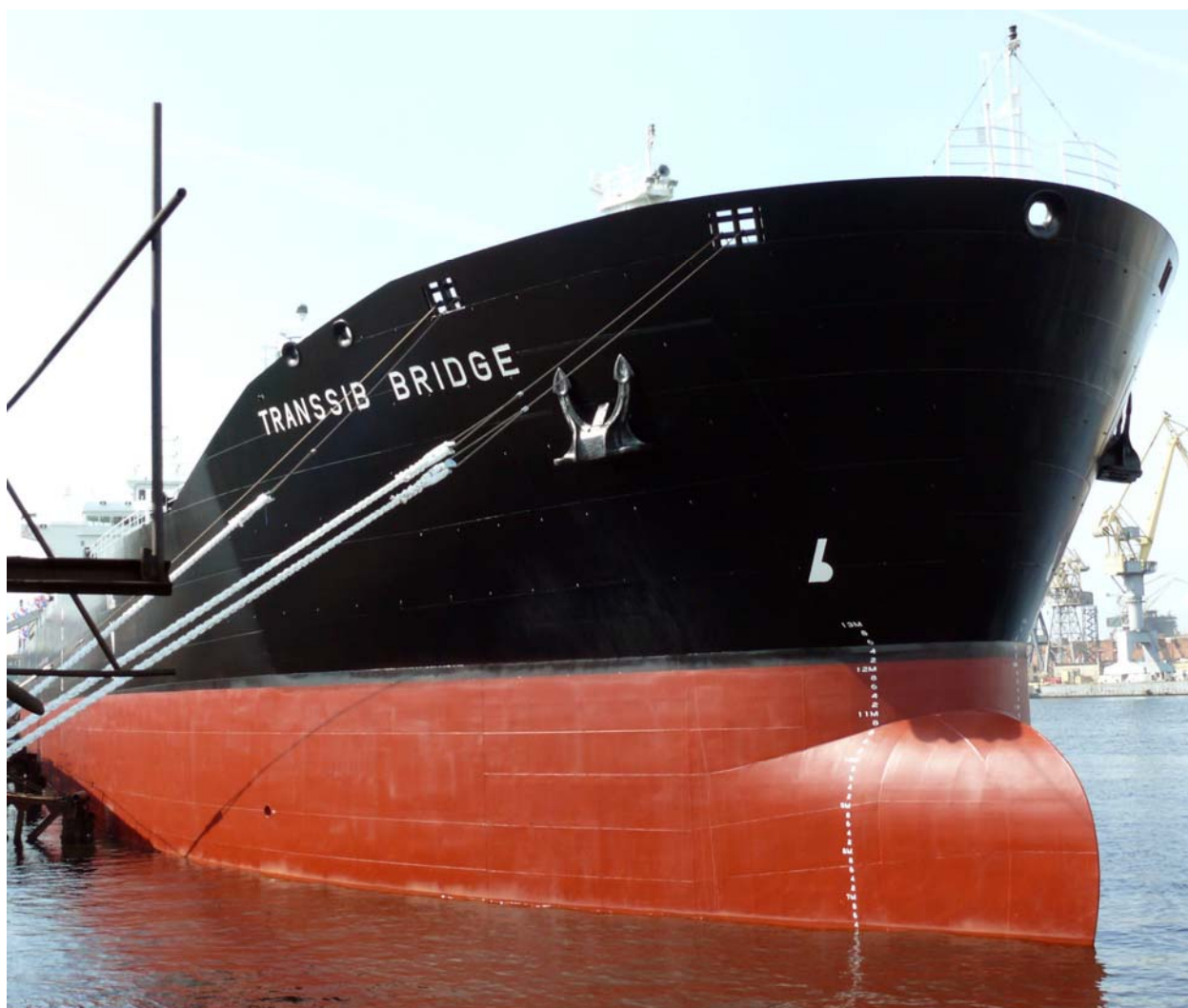
Главные размерения танкера «Транссибирский мост»: